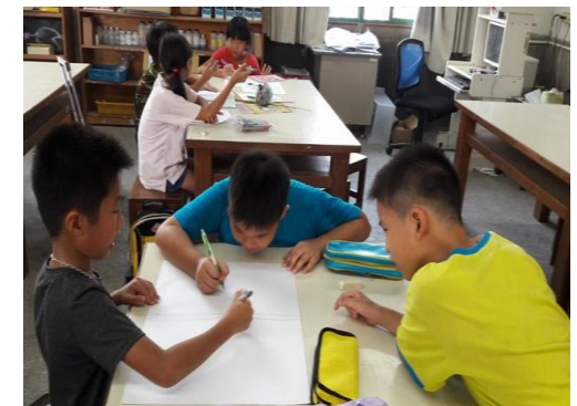
功課完成，一起畫畫