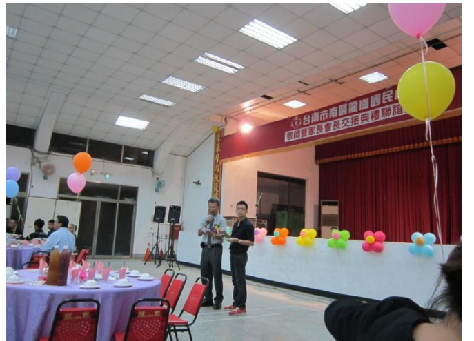
利用家長會餐會時進行菸檳防治宣導。