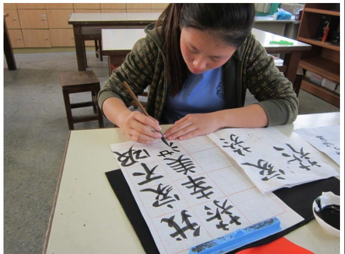
將菸害防治議題融入書法課程。