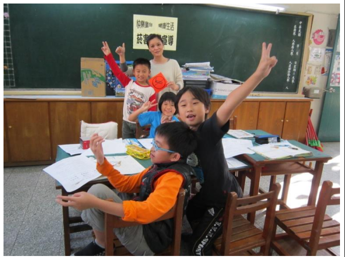
隨班宣導菸害防治新政策。